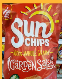
Sunchips Garden Salsa