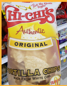
Chi-Chi's Original Authentic

Los siguientes tipos de totopos son ejemplos que cumplen los criterios necesarios para ser considerados WGR en el programa CAC- FP a la fecha de esta publicación. Se recomienda revisar las listas de ingredientes de los productos para verificar que son WGR antes de comprarlos. Es posible que también califiquen totopos de otras marcas, tipos y sabores.