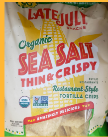
Late July Organic Sea Salt Thin & Crispy