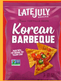
Late July Clásico Korean Barbeque