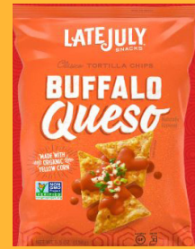
Late July Clásico Buffalo Queso