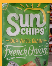
Sunchips French Onion