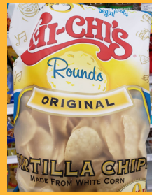
Chi-Chi's Original Rounds