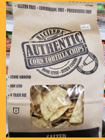
Hacienda Authentic Corn Tortilla Chips