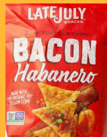
Late July Clásico Bacon Habanero