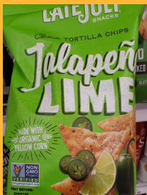
Late July Clásico Jalapeño Lime