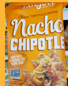
Late July Clásico Nacho Chipotle