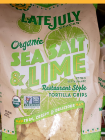
Late July Organic Sea Salt and Lime