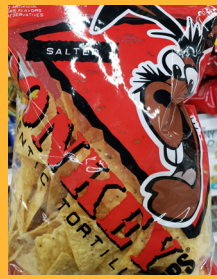
Donkey Tortilla Chips