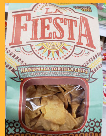
La Fiesta Handmade Tortilla Chips