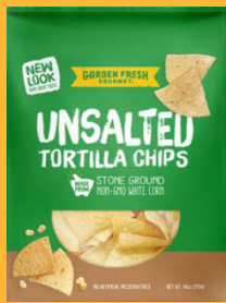
Garden Fresh Unsalted Tortilla Chips