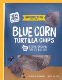
Garden Fresh Blue Corn Tortilla Chips