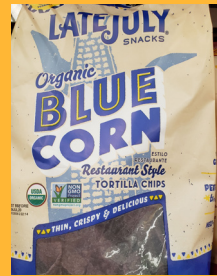
Late July Organic Blue Corn