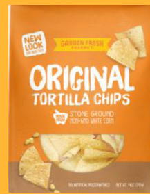
Garden Fresh Original Tortilla Chips