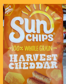
Sunchips Harvest Cheddar